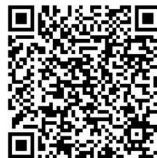
民办义务教育、学前教 育及其他文化教育学校 设立审批（谯城区）