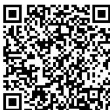
文艺表演团体从事营业 性演出活动审批 (谯城区)