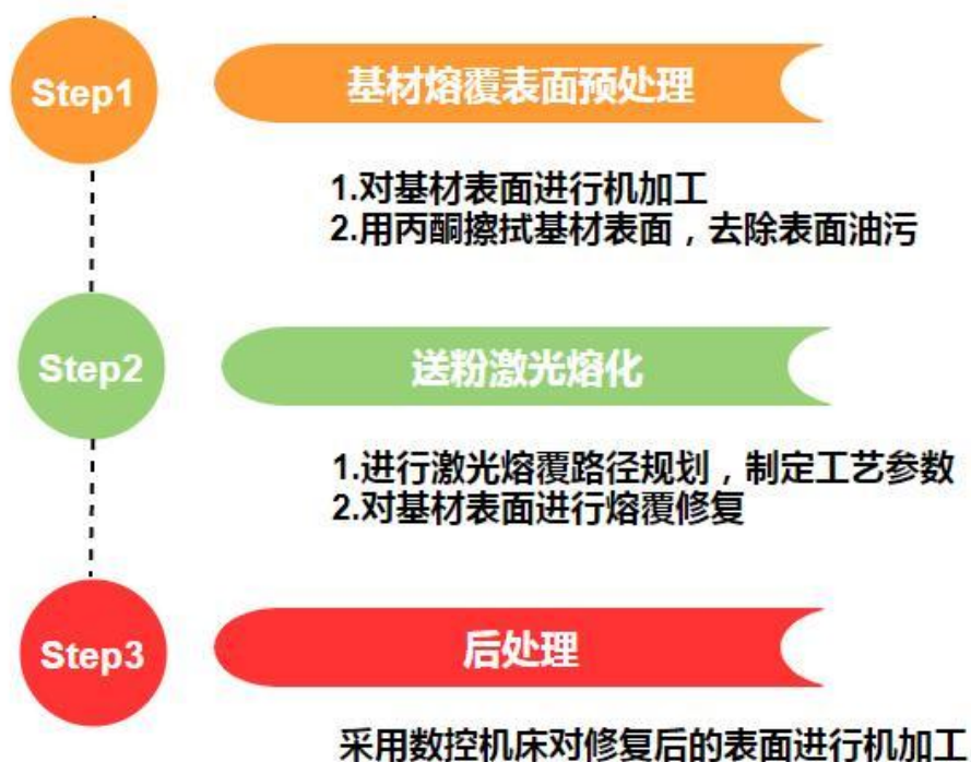
图 2 超高速激光熔覆技术工艺流程图

通过精准控制激光束与粉末流空间作用位置，优化分配激光能量，实现粉末颗粒在基材上方汇聚并熔化至液态，进入基材微熔池，缩短粉末颗粒熔化以及与基材结合凝固所需要时间，提高激光熔覆效率，降低成本。超高速激光熔覆技术工艺流程如图 2 所示。